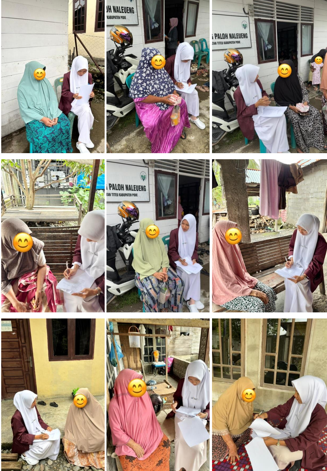
FOTO KEGIATAN PENELITIAN